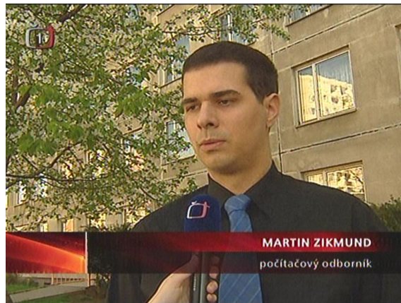
Obrázek 12.4.: V televizi vystupuje jako počítačový odborník.