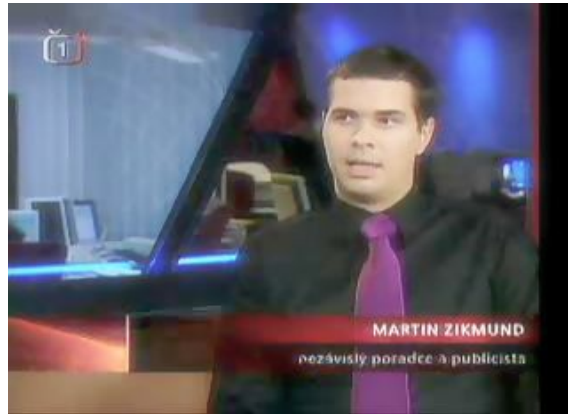
Obrázek 12.3.: Ve studiu České televize