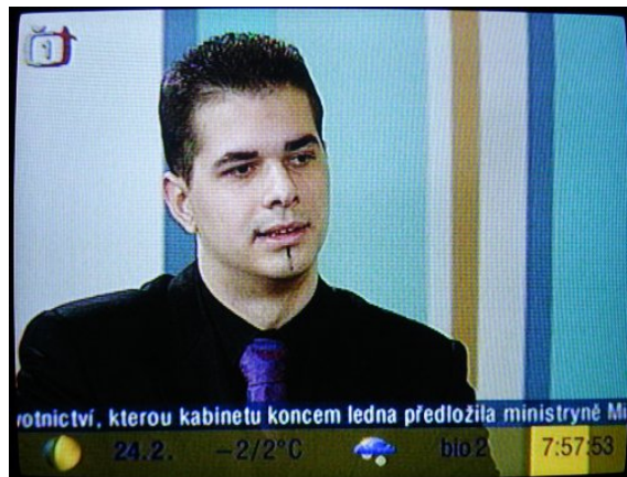
Obrázek 12.1.: „Žádný operátor by nechtěl rozpoutat cenovou válku ve státě, kde je penetrace přes 100%.“

§ 1. V pořadu Dobré ráno dne 24. 2. 2005