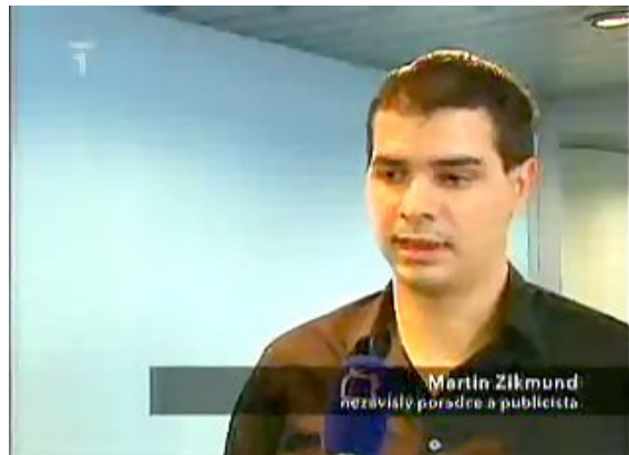
Obrázek 12.6.: Nezávislý poradce a publicista ve zprávách České televize.