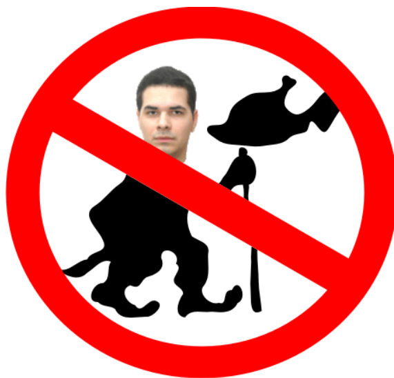
Obrázek 9.1.: Tato výstražná značka varuje před možným rozbřednutím diskuzního tématu.