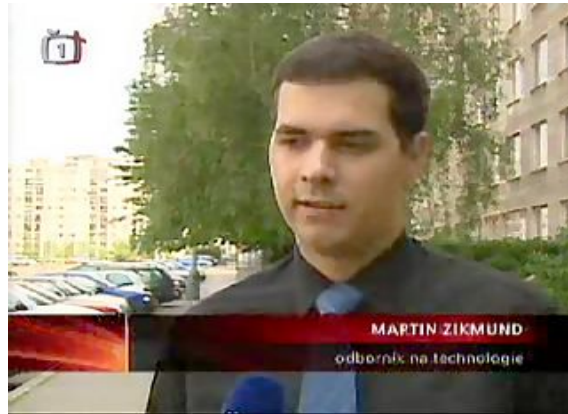
Obrázek 12.5.: Odborník na technologie hodnotí družicový navigační systém