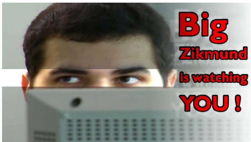
Obrázek 7.1.: V remaku nejslavnějšího románu George Orwella 1984 není ústředním zařízením velká obrazovka, ale malý mobilní telefon sítě 3. generace.

Protentokrát je demokracie v ČR zachráněna a z potlačování názorů je usvědčen zlotřilý redakční systém. Ovšem to že trpíte paranoiou, ještě neznamená, že po vás opravdu nejdou. . .