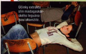
Účinky extraktu slin madagaskarského leguána jsou okamžité.