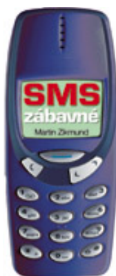
Obrázek 11.1.: Příručka SMS zábavné